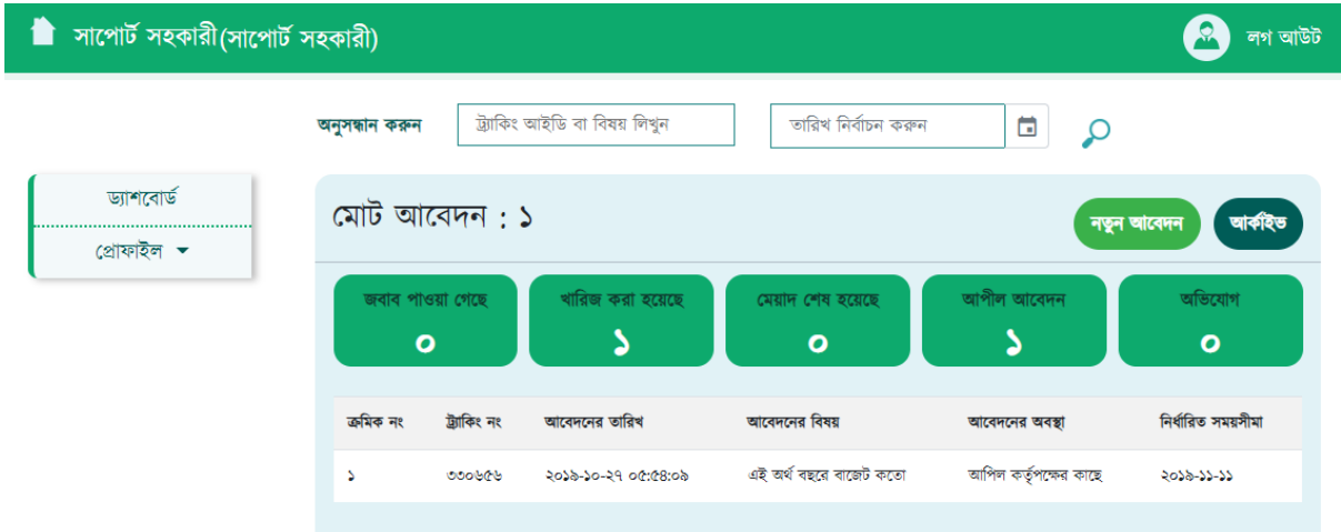
চিত্র: ৪ (সাপোর্ট সহকারীর ড্যাশবোর্ড)

নবম ধাপঃ আপনি একজন সাপোর্ট সহকারী হিসেবে অনলাইন ট্র্যাকিং সিস্টেমে লগ ইন করার মাধ্যমে আপনার ড্যাশবোর্ড ব্যবহার করতে পারবেন। এই ড্যাশবোর্ডে আপনি 'প্রোফাইল', 'আবেদনের অবস্থা', 'আপীল', 'অভিযোগ' অপশনগুলো পাবেন। 'প্রোফাইল' বাটনে ক্লিক করে আপনি আপনার প্রোফাইল এডিট করতে পারবেন। আপনার অ্যাকাউন্টের পাসওয়ার্ড পরিবর্তন করতে পারবেন। 'আবেদনের অবস্থা' বাটনে ক্লিক করে আপনি নাগরিককে যেসব আবেদন করতে সাহায্য করেছেন সেগুলোর বিস্তারিত দেখতে পারবেন। 'আপীল' বাটনে ক্লিক করে যে সব আবেদন আপীল পর্যায়ে গেছে সেগুলোর বিস্তারিত দেখতে পারবেন। 'অভিযোগ' বাটনে ক্লিক করে যে সব আবেদন অভিযোগ পর্যায়ে গেছে সেগুলোর বিস্তারিত দেখতে পারবেন। আপনি ড্যাশবোর্ডের উপরে 'অনুসন্ধান' বাক্সে আপনি নাগরিককে যেসব আবেদন করতে সাহায্য করেছেন সেগুলো খুঁজতে পারবেন। এর নিচের অংশে আপনি মোট আবেদনের সংখ্যা দেখতে পারবেন। এবং সবগুলো আবেদনের একটি তালিকা দেখতে পারবেন। এই তালিকা থেকে আপনি প্রতিটি আবেদনের বিস্তারিত দেখতে পারবেন। ড্যাশবোর্ডের ডানপাশে আপনি লগ আউট করার অপশন পাবেন। (চিত্র: ৪)