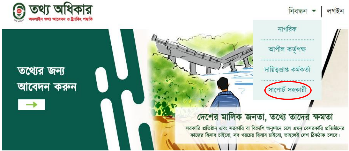
চিত্র: ১ (সাপোর্ট সহকারী নিবন্ধন)

তৃতীয় ধাপঃ ওয়েবসাইটের 'নিবন্ধন' বাটনে ক্লিক করলে আপনি ড্রপ-ডাউনে চারটি অপশন দেখতে পারবেন (চিত্র: ১)। অপশনগুলোর মধ্য থেকে 'সাপোর্ট সহকারী' এর উপর ক্লিক করলে সাপোর্ট সহকারীর নিবন্ধনের পৃষ্ঠাটি দেখতে পারবেন।